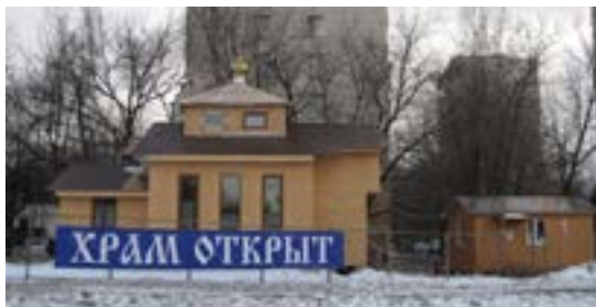
Храм Прп. Александра Свирского в Грайвороново