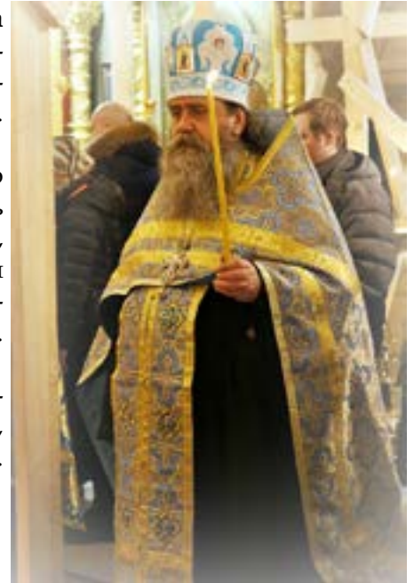
Тропарь Сретению Господню, глас 1